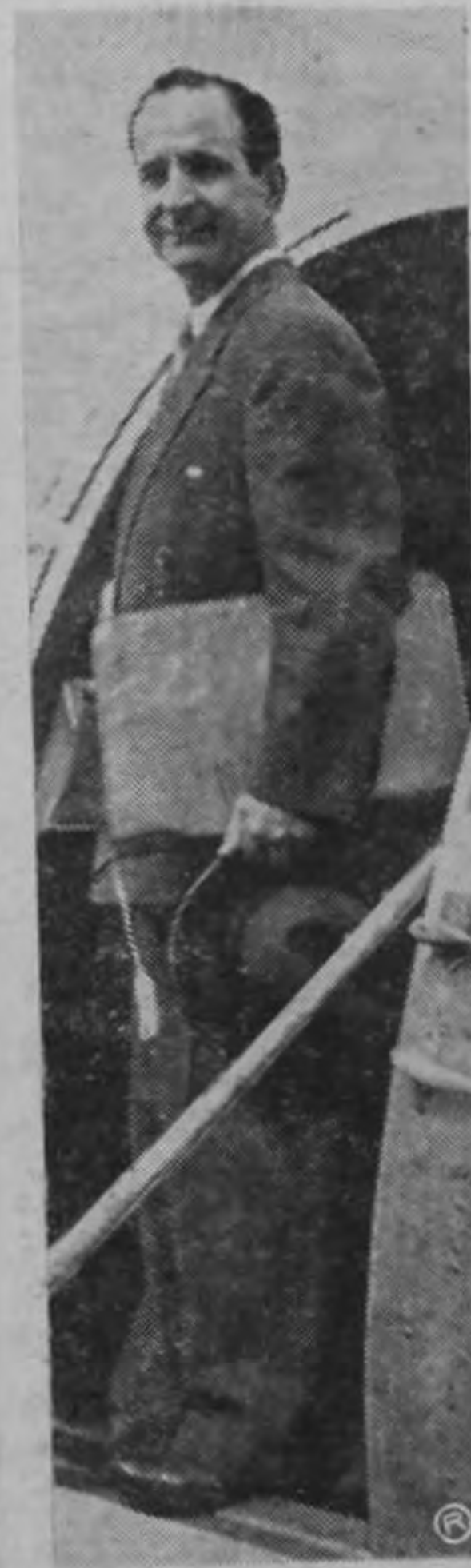
Don José Figueres, Presidente Electo de Costa Rica para el periodo constitucional que se inicia el próximo 8 de noviembre, momentos antes de ingresar a la cabina del avión militar salvadoreño en el que hizo viaje a yer al país hermano.