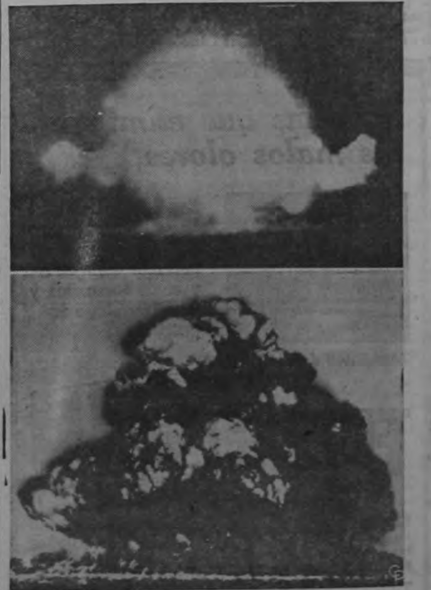
LA GRAN BRETASA ENSAYA NUEVA ARMA ATOMICA. La familiar nube en forma de hongo (arriba) provocada por una explosión atómica comienza a formarse en el campo experimental de Woomera, en el desierto del sur de Australia. Abajo, la mortal nube de partículas radio-activas comienza a dispersarse. No se han dado informaciones oficiales sobre el tipo de arma que se hizo detonar.

—En Villa Colón tuvo lugar un serio percance de tránsito. Una vagoneta de Obras Públicas se volcó resultando varias personas, entre ellas una grave que fué pasada al Hospital San Juan de Dios. El volcamiento se produjo a consecuencias de que el chofer manejaba en estado de ebriedad.