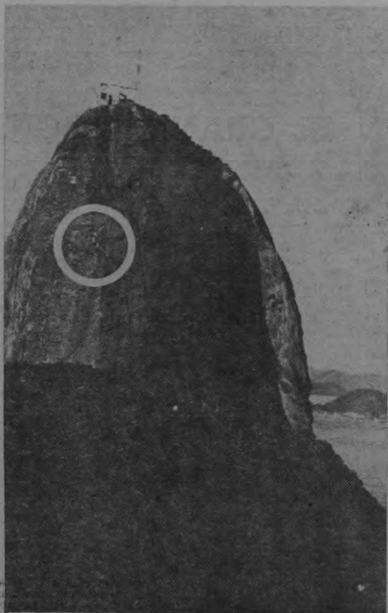
...Los "Astros del Espacio", evolucionando frente a la muerte, sobre el gigantesco Morro brasilero "Pan de Azúcar"...

PIEL ROJA, bajo "PROCESO AT" agrada infinitamente!