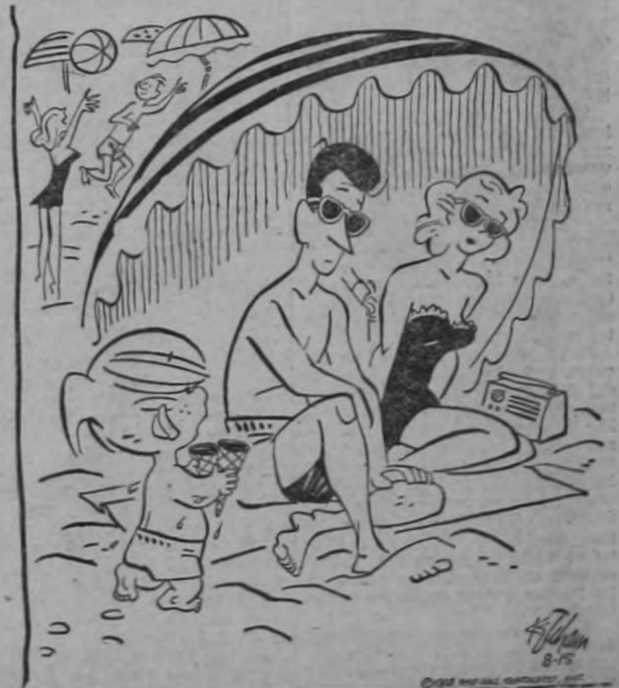
El helado de ustedes se estaba derretiendo tanto que tuvo que comérmelo para que no se perdiera...